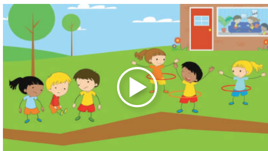
Voor een korte impressie van Het Bewegend Kind, klik op de afbeelding.

Meer informatie op www.hetbewegendkind.nl of mail naar info@hetbewegendkind.nl